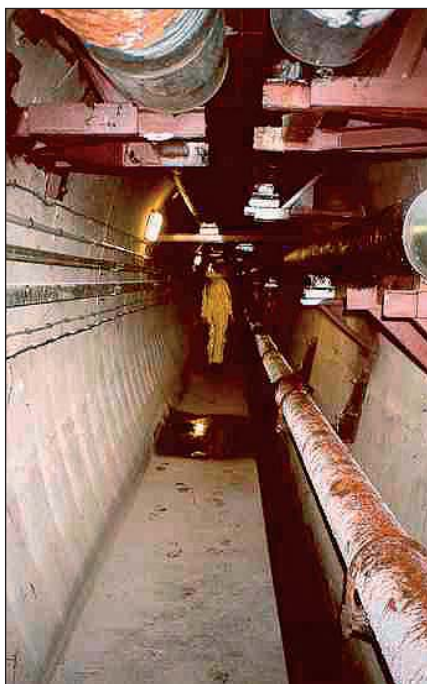
Photo 1 Galerie multiréseaux rue de Picardie Multiple-network gallery on Rue de Picardie