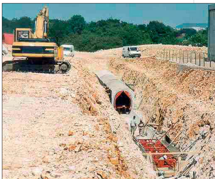
Photo 3 Construction galerie multiréseaux ZAC des Hauts du Chazal Construction of a multiple-network gallery for the Hauts du Chazal "ZAC" (mixed development zone)